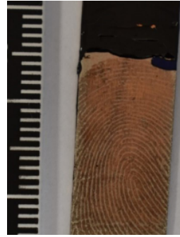
Слика 4в. Фојфографија прста папиларних линија изазваној методом таложења мейала (Ni на прлочи Cu) 6

Ради утврђивања квалитета трага и могућности идентификације лица на основу трага, траг је у оба случаја класификован по Вучетићевој методи и пронађене су идентификационе карактеристике. Такође, класификован је и отисак прста добијен дактилоскопиранием, и то притиском. У питању је петљани отисак удесно (ШП6). На траговима и отиску пронађено је следећих 12 карактеристика (минуција): спојен врх папиларне линије са петљом у центру отиска (карактеристика 1); задебљање на другој папиларној линији изнад карактеристике 1; прекид папиларне линије у центру отиска; рачва шесте папиларне линије десно изнад карактеристике 1; рачва пете папиларне линије лево изнад карактеристике 1; рачва осме папиларне линије изнад карактеристике 1; рачва девете папиларне линије лево од делте; завршетак осме папиларне линије лево изнад карактеристике 1; рачва петнаесте папиларне линије лево од карактеристике 1; делта; рачва дванаесте папиларне линије лево изнад карактеристике 1 и завршетак девете папиларне линије десно изнад карактеристике 1.