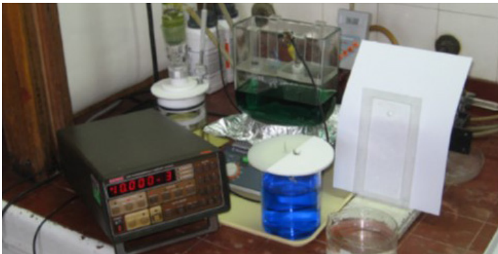
Слика 3. Лабораторијска апаратура за електрохемијско таложење металних филмова: извор константне струје (1), кадица са електролитом за електрохемијско таложење никла (2), магнетна мешалица са регулацијом температуре (3), десиливана вода за испирање након таложења (4)

Електролит који је коришћен за таложење никла је смеша и садржи никл-сулфат, никл-хлорид, борну киселину и сахарин. Вредности рН и температуре износиле су 4,00 и 50°C. Густина струје у експерименту одржавана је на 50 mA/cm 2 . Изабрани састав електролита и вредности процесних параметара омогућавају да се добију филмови ситнозрне структуре са величином кристалног зрна (кристалита) испод 1 μm, мале храповости и малих унутрашњих напрезања, што је значајно за добру адхезију на бакарној подлози. Трајање процеса је дефинисано на основу измерене површине за електрохемијско таложење, жељене дебљине филма и густине струје, и у приказаном случају је износило два минута. На Слици 3 је приказана лабораторијска поставка за електрохемијско таложење металних филмова. Апаратура се састоји од извора константне струје (за рад у ДЦ галваностатском режиму), металних проводника, кадице са електролитом, металних електрода и магнетне мешалице са температурном сондом за прецизну регулацију температуре.