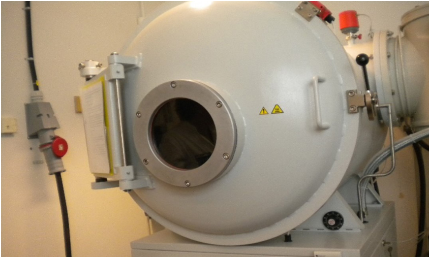
Слика 1. Уређај за визуелизацију латентних трагова папиларних линија помоћу вакуумског таложења метала (Vacuum Metal Deposition – VMD) 5

Визуелно испитивање подразумева примену оптичких метода у области видљивог дела спектра, док флуоресцентно испитивање подразумева коришћење метода у области ван видљивог дела спектра. Вакуумско таложење метала је процес који се одвија на следећи начин: најпре се узорак са трагом ставља у комору са вакуумом; узорци се напарављају честицама злата које се таложе у међупапиларном простору, а не на папиларним линијама, јер масноћа из зноја са папиларних линија спречава честице да се залепе за траг; у следећој фази се узорци напарављају цинком, који се лепи за честице злата и појачава развијену слику. Резултат је негатив отиска прста. Овај поступак се примењује на непорозним и немасним површинама, као што су фини текстил, пена, стакло, пластика и сл. Код старијих трагова вакуумско таложење метала обично даје боље резултате од цијаноакрилатне методе. Ова метода је први пут примењена у Великој Британији 1976. године и веома је скупа. (International Fingerprint Research Group (IFRG) – Guidelines for the assessment of fingerprint detection techniques, 2014)