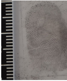
Слика 4б. Фојфографија прста папиларних линија изазваној дактилоскопским прашком „инстант црни” и јодинојој трансјаренином фолијом са белом подлоом