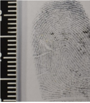
Слика 4а. Фојфографија отиска прста узетио дактилоскопиранием