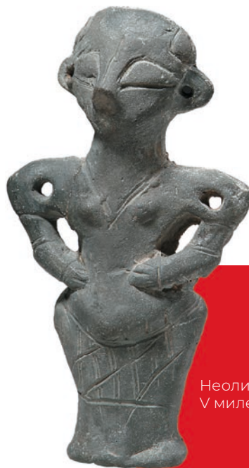
Неолитска фигурина, V миленијум п. н. е.

Вредност украдених трезора износи 2–6 милијарди долара годишње. Реч је о трећој, најпрофитабилнијој криминалној грани, одмах иза трговине дрогом и оружјем, која је у финансијској вези с другим формама криминала – од трговине дрогом и оружјем до тероризма. Већина држава у свету је, у складу са својим интересима, ратификовала неке од постојећих међународних конвенција о културним добрима, које чине основу за увођење законодавних решења прилагођених територији, култури и судском систему сваке од земаља. Криминал у вези с уметнинама по својој природи је транснационалан и захтева сталну сарадњу полицијских и културних институција које раде на стварању база података крадених уметничких дела и антиквитета, кријумчара или кривотворитеља уметнина.