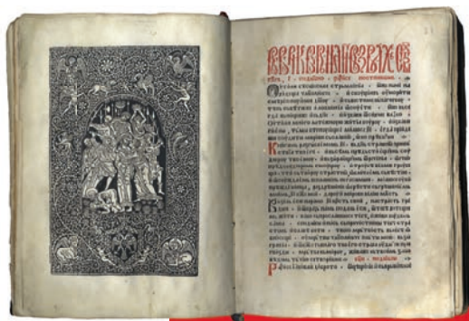
Октоих петогласник, Манастир Дечани бр. 156