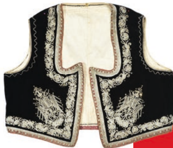
Јелек „круна“, Понишавље

Од свог оснивања 1946. године Међународни савет музеја (International Council of Museums – ICOM) активан је у широком спектру дисциплина које се односе на баштину и музеје. У борби против нелегалне трговине уметничким делима и антиквитетима, ICOM развија најбоље методе и праксе у области заштите културне баштине. Због тога је осмислио данас светски познате и незаменљиве инструменте за очување светске културне баштине – Црвене Листе угрожених културних добара.