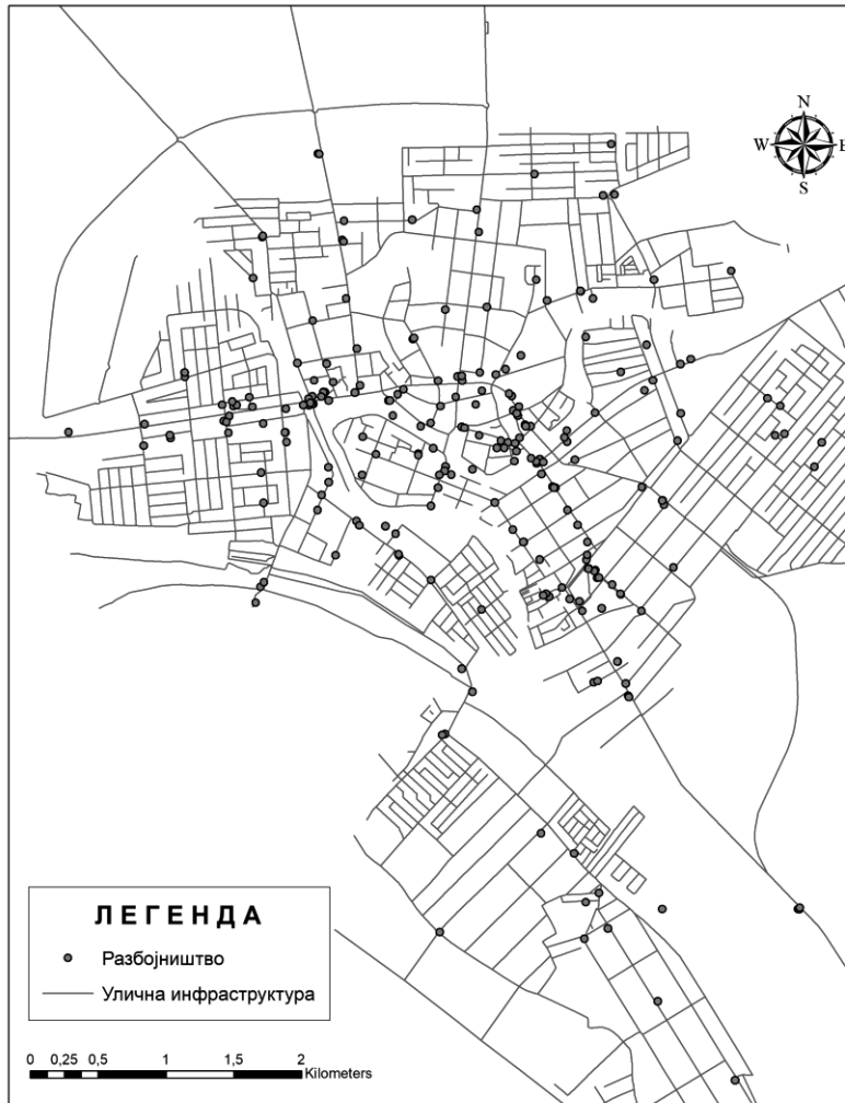
Слика 1. Тематска карта дистрибуције кривичних дела разбојништва на територији Града Зрењанина у периоду 2008–2019. године

На тематској карти могуће је уочити релативну правилност, тј. интензитет у груписању кривичног дела разбојништва. 5 Такође, на тематској карти можемо уочити