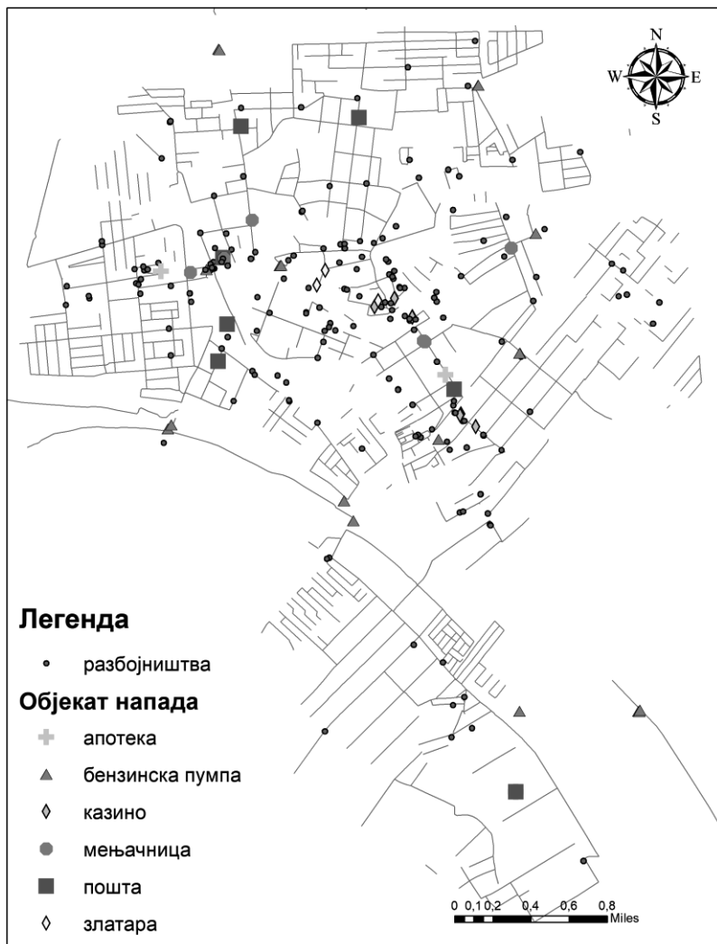
Слика 2. – Тематска карта кривичних дела разбојништва по објектима напада

Након тога приступило се идентификацији и анализи криминалних жаришта у микрогеопростору (Милић, 2015: 111). Уочавање локација или геопростора жаришта могуће је на неколико начина. Аутори су се одлучили да таква места представе тематском картом густине . Наиме, поступак подразумева да се карта прекрије мрежом квадратних поља, а затим се сваком пољу