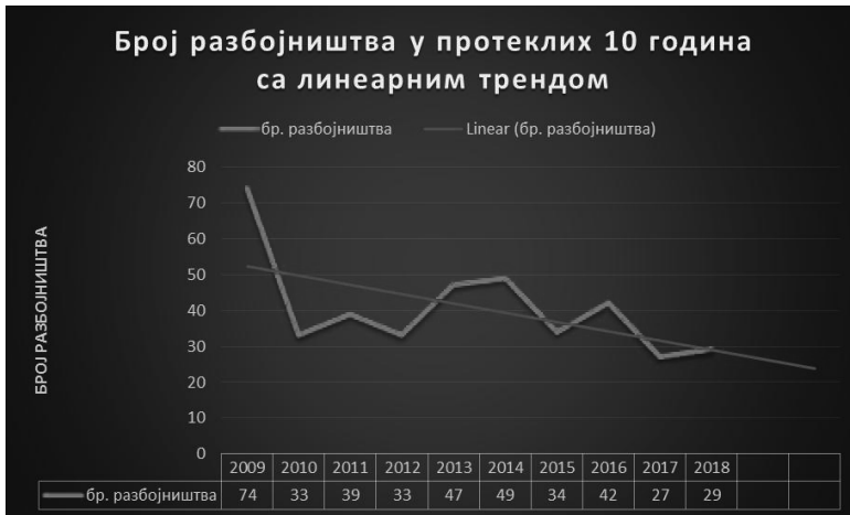
Графикон 1. – Број кривичних дела разбојништва на територији ППУ Зрењанин

извршеној статистичкој анализи постоји линеарни тренд опадања броја извршених кривичних дела (графикон 1).