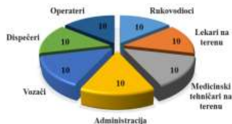
Grafikon 3. Zanimanje ispitanika