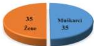
Grafikon 1. Polna struktura ispitanika

U istraživanju je učestvovalo 70 ispitanika (35 muškaraca i 35 žena), starosti od 22-62 godine, koji su obavljali poslove rukovodioca, lekara, medicinskih tehničara, dispečera, operatera, administracije i vozača (grafikon 1, 2, 3).