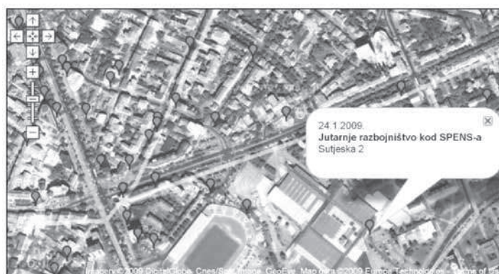
Слика 4 – Локације извршених кривичних дела разбојништва на делу територије Новог Сада у периоду од 1. 1. 2009. до 28. 9. 2009. године 13

Као што је већ речено, интернет приступ подацима о криминалу данас је уобичајен у пракси модерних полицијских организација (САД, Велика Британија и др.). Већина њих препознала је предности Интернет карти када је реч о унапређењу сарадње (партнерства) са грађанима, међутим, оно по чему се разликују јесте визуелни изглед картографских приказа, као и квалитет (и квантитет) података који се на њима налазе. Нажалост, када је реч о Интернет картама криминала, у нашој полицијској пракси се о томе још увек озбиљно не размишља 11 . То ипак не значи да код нас нема јавно доступних карти криминала. Тако удружење грађана „Новинарски истраживачки центар“ израђује карте криминала за подручје Новог Сада 12 . Пример овог удружења показује како се уз мало воље, са ограниченим материјалним средствима, могу направити солидне карте криминала (слика 4).