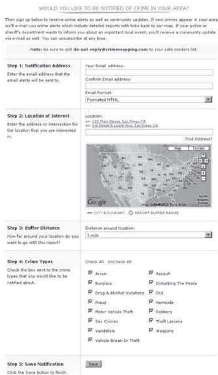
Слика 2 – Регистравање корисника за услугу обавештавања путем e-mail -а о стању и кретању криминала 9

упозоравају да је на подручју на којем они живе увећан ризик од виктимизације, и притом добијају савет како да се заштите, на шта да обрате пажњу и сл. На сличан начин као телефонски бројеви, из базе података се могу добити e-mail адресе претходно регистрованих грађана (слика 2), бројеви мобилних телефона на које би се слале СМС поруке итд.