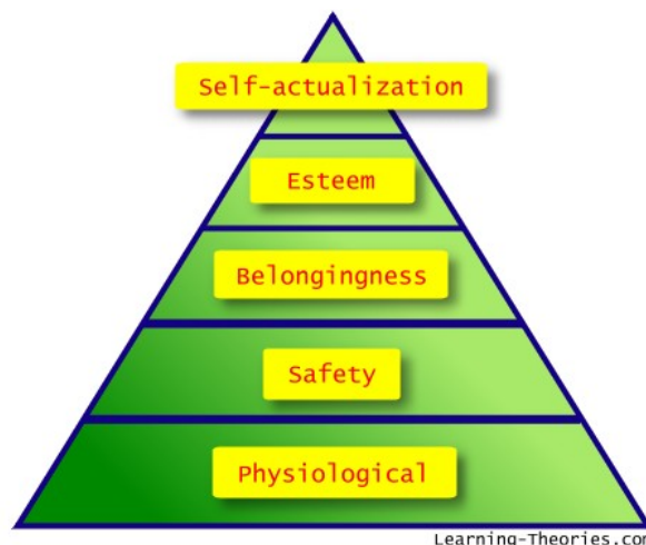
Slika 1 - Maslovljeva hijerarhija ljudskih potreba

U cilju zadovoljenja jedne od najvažnijih ljudskih potreba i ispunjenja jednog od preduslova održivog razvoja, borba protiv kriminala zauzima značajno mesto. Cilj ovog rada je da ukaže na značajan uticaj prevencije kriminala kroz oblikovanje prostornog okruženja ka ostvarenju ciljeva održivog razvoja, kroz fizički, društveni i ekološki aspekt u odnosu na savremene pristupe prevencije kriminala.