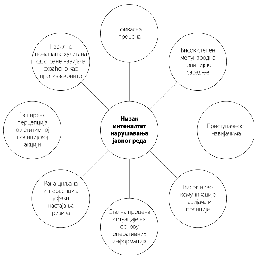
Слика број 2: Полицијске мере које доприносе смањењу насиља на спортским приредбама

Као што се могло приметити, наведено је осам фактора који доприносе ниском интензитету нарушавања јавног реда, међу којима је и висок степен међународне полицијске сарадње. Сви наведени фактори не могу се сврстати у исту групу, али такође се не може направити потпуна градација од најважнијих, ка онима који су мање битни. Може се само само констатовати, да је степен међународне полицијске сарадње један од битнијих фактора који доприноси да до насиља не дође 5 . Због тога ће у овом делу текста бити посебно размотрена међународна полицијска сарадња, а остале полицијске мере, које доприносе смањењу насиља, биће размотрене и приказане опширније у делу где