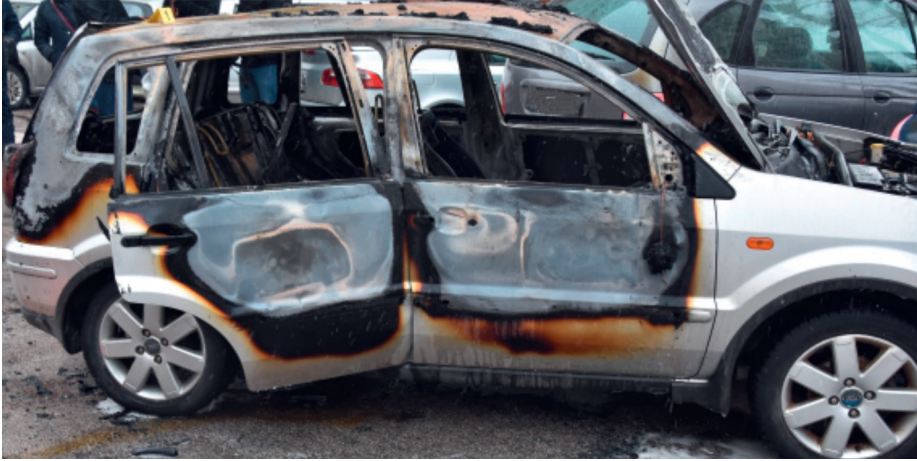
Photograph 7. The appearance of a vehicle side affected by spontaneous burning due to a defect on the heating installations in the driver's seat

In such situations, the described trace is more difficult to spot, yet it may be present, so a distinction can be drawn between burning of upper and lower parts of the door, and the trace can be preserved in a photograph. This trace may lead us to a conclusion as to where the center of fire was and it is the place where we should look for the cause of fire.