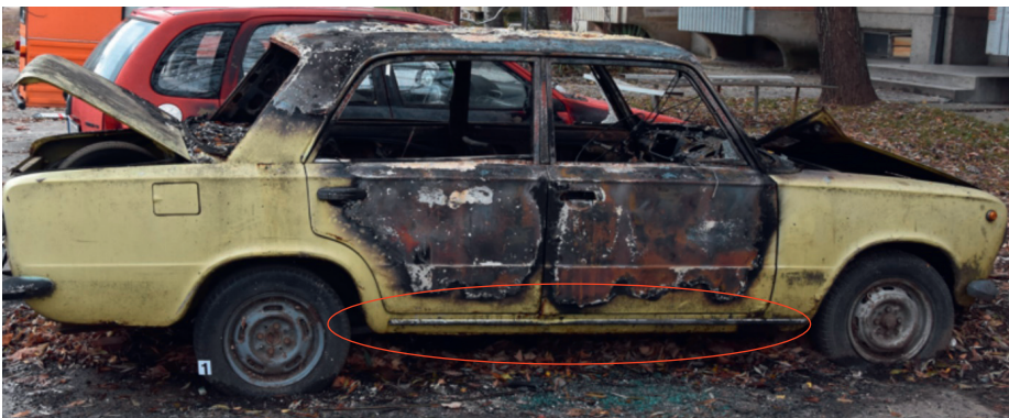
Photograph 8. The appearance of a vehicle following self-ignition of the central console inside the passenger area

In such situations, the described trace is more difficult to spot, yet it may be present, so a distinction can be drawn between burning of upper and lower parts of the door, and the trace can be preserved in a photograph. This trace may lead us to a conclusion as to where the center of fire was and it is the place where we should look for the cause of fire.