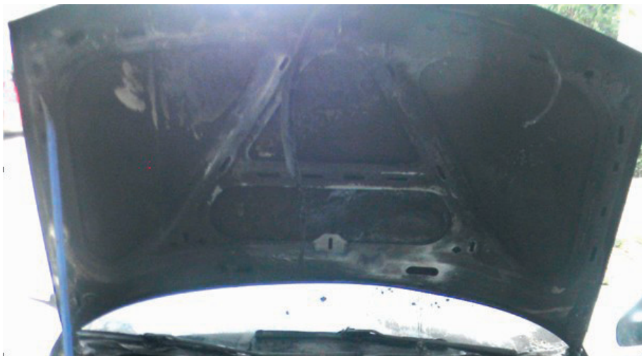
Фотографија 3. Ојачања поклопца мотора са унутрашње стране

тако да не би долазило до печатног (местимичног) сагоревања, јер не постоје препреке. Другим речима, пожар не би, условно речено, „прескакао” материјал истог састава.