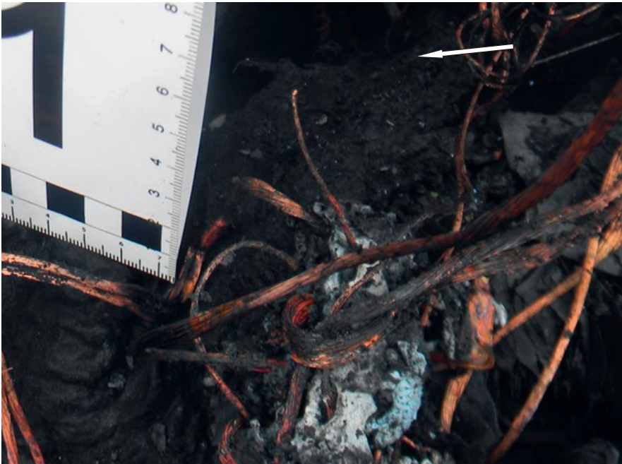
Photograph 5. The trace of a short circuit.

attention should be paid to all traces that support the version that any specific case involves spontaneous ignition of the vehicle, but we also have to explain possible presence of traces which may indicate otherwise. An old rule of crime scene investigation requires that we must have at least two versions of the case under review. In order to establish the whole truth in the course of investigative proceedings, it is not sufficient to prove the truthfulness of one version, but also the untruthfulness of all other versions.