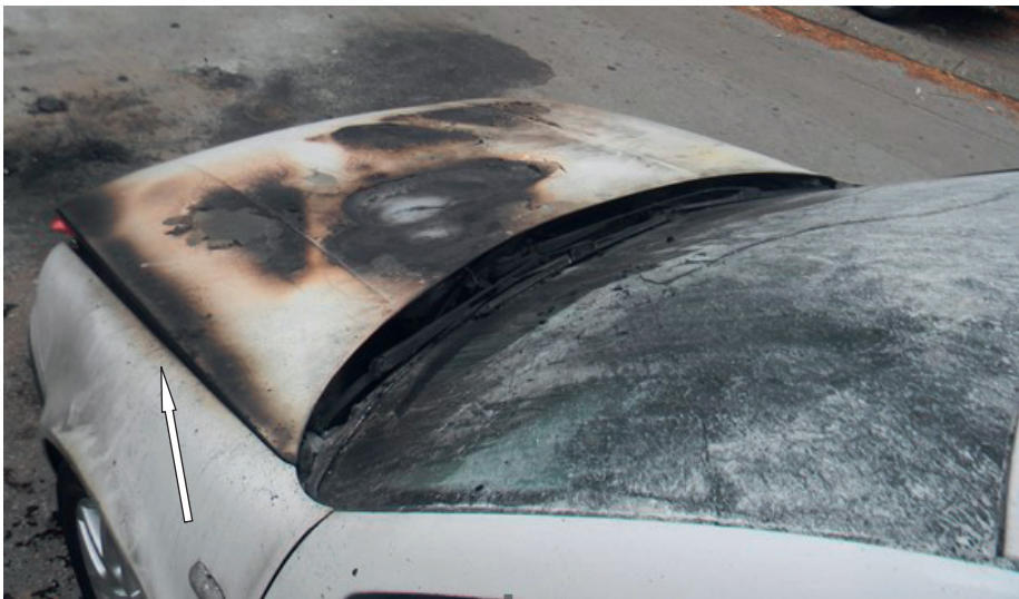
Photograph 4. Smoke halo on the edge of the hood.

A smoke halo is yet another in the multitude of traces that may be found in the course of fire scene investigation and forensic processing of burned cars (Photograph 4). This trace rules out both the possibility of combustion accelerator presence on the hood and the possibility that the fire started on the outside surface of hood. If the surface of the hood had been splashed with combustion accelerating agent, such as, for instance, petrol, it would drip under the influence of gravity and we would quite certainly have traces of overheating on the front edge, as the lowest point of the hood.