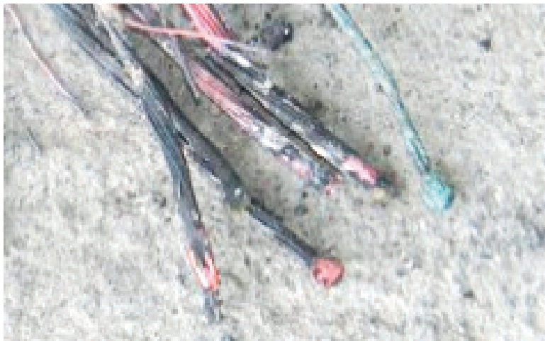
Photograph 1. Traces of short circuits - causes of fire

The causes of fire can include: overheating of electric conductors, coils or other devices that conduct electrical power, a short circuit, sparks, and electrothermic devices (Aleksić, Kostić, 1982:40). All of these causes leave characteristic traces of conductor melting in the form of round and solid changes in the cross-section of the conductor – the form of ‘balls’, bulges, tears, berries, etc. These characteristic traces occur as a consequence of sparks, short circuits or electric arc, and can be found on the conductors themselves or on the materials present in their immediate proximity.