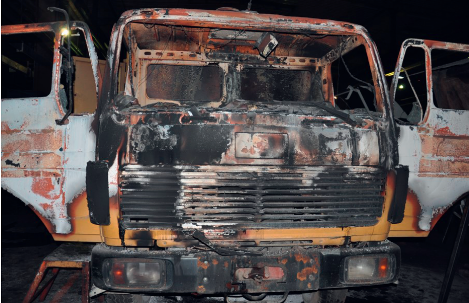
Photograph 6. The appearance of a truck in which fire started in the cabin due to a short circuit on the installation around the fuse

Photographs 7 and 8 show a typical example of a fire center in the passenger area, which is characterized by the lower burning line on the doors and on the lower side edges of the vehicle. These are the places where unburnt combustible matter (paint and varnish) always remains, clearly delineating the burning on the door, which is not vertically interrupted . It stretches along the lower side edges, mostly at the same height, as shown in Photograph no. 8.