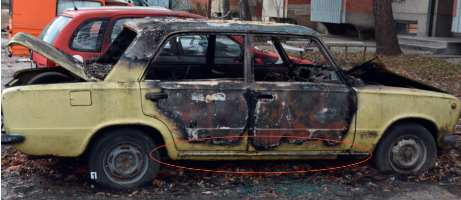
Фотографија 8. Изглед возила након самозапаљења централне конзоле унутар кабине

У таквим ситуацијама описани траг је теже уочљив, али ипак може постојати и може се направити разлика у горењу горњих и доњих делова врата, а може се и фиксирати фотографијом. Овај траг нас наводи на закључак где је центар пожара, те на том месту треба тражити и узрок пожара.