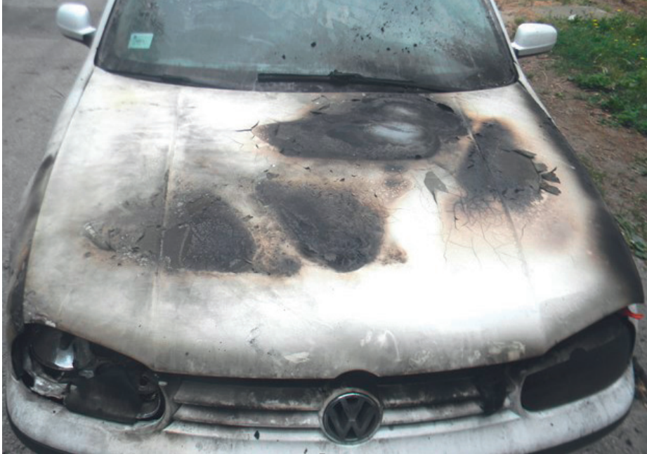
Фотографија 2. Печатно прегоривање на поклопцу мотора са спољашње стране

Ови трагови се могу пронаћи на спољашњој површини поклопца мотора, по ивицама поклопца мотора, на унутрашњој површини поклопца мотора и на електроинсталацијама испод поклопца мотора. Сваки пронађени траг треба детаљно, јасно и стручно образложити и поткрепити фотографијама у складу са правилима струке.