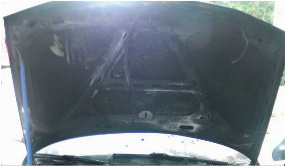
Photograph 3. Hood reinforcement on the inside

have burned evenly, so there would be no seal-like (partial) burning, because there would have been no obstacles. In other words, the fire would not have ‘skipped’ the material of the same composition.