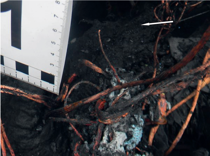
Фотографија 5. Траг кратког споја

конкретном случају ради о самозапаљењу возила, али свакако треба објаснити и евентуално присуство трагова који можда показују супротно. Старо је криминалистичко правило да у вези са конкретним догађајем морамо имати најмање две верзије. За утврђивање пуне истине у склопу криминалистичке обраде није довољно да се докаже истинитост једне верзије, већ је потребно доказати и неистинитост свих осталих.