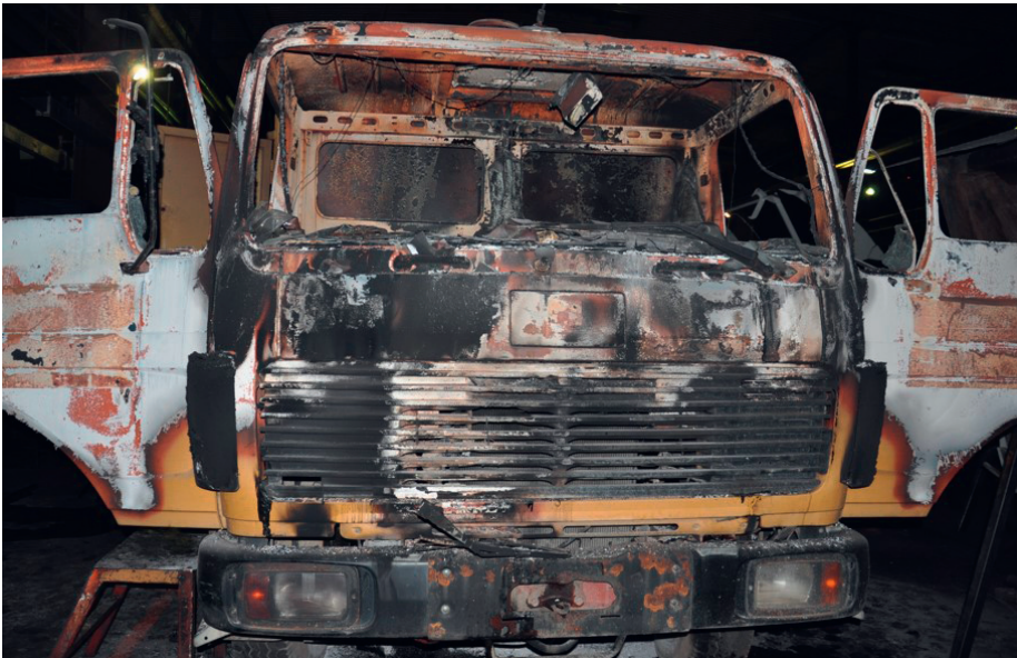
Фотографија 6. Изглед камиона када је пожар почео у кабини, а узрок је кратак спој на инсталацијама у пределу осигурача

Ако је до пожара дошло у кабини возила, увек треба проверити могућност настанка пожара деловањем жара неугашене цигарете која је испала на неку лако запаљиву материју у кабини возила или услед тињајућег горења неугашеног опушка у пепељари пуној других опушака, папирних марамица, комадића папира и томе слично. Такође, у склопу криминалистичко-форензичке обраде лица места увек треба изузети узорак из центра пожара ради утврђивања евентуалног присуства поспешивача горења. Када пожар почне унутар кабине возила у ситуацијама самозапаљења, најугроженији је тај централни део возила. Пожар ће се развијати равномерно у свим правцима са тенденцијом нагоре, као и увек. Ако су врата и прозори затворени, у кабини возила постићи ће се ефекат „рерне” на исти начин као и код самозапаљења возила у простору око мотора када је поклопац мотора затворен. То значи да ће сви гориви материјали (тканина, пластика, сунђер, гума и друго) бити термички деградирани у зависности од интензитета и трајања пожара.