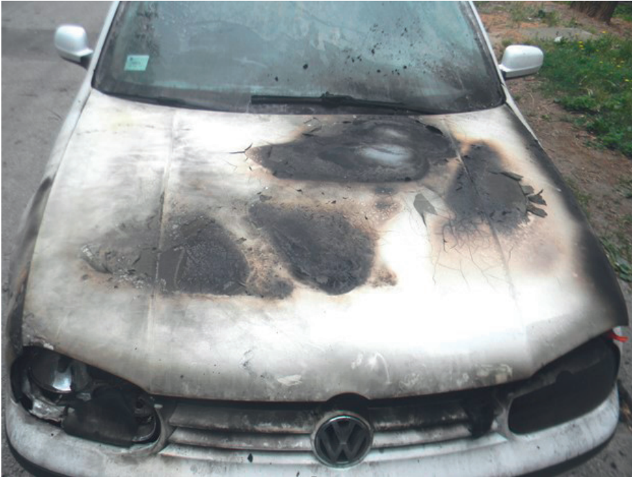
Photograph 2. Seal-like burning marks on the outside of the hood

These traces can be found on the outer surface of the hood, alongside hood edges, on the inside of the hood and on electrical installations under the hood. Every trace that is found needs to be meticulously, clearly and expertly elaborated on and accompanied by photographs in keeping with the rules.