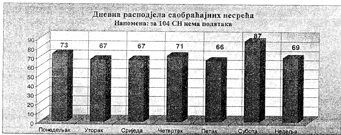
Графикон бр. 1

Анализирајући саобраћајне незгоде на простору Града Бања Луке долази се до података који су нас упутили на индиректну везу саобраћајних незгода са угоститељском делатношћу. Ови резултати упућују на индиректну везу саобраћајних незгода и феномена који смо назвали "путовања и изласци ради забаве" који се дешавају у дане викенда. Ова путовања се могу довести у везу са забавом која подразумева конзумирање алкохолних пића у угоститељским објектима. Конзумирање алкохолних пића у угоститељским објектима, као и возња моторних возила након тога, сигурно су ризици који доводе и могу довести до саобраћајних незгода. С обзиром да је идентификован посебан проблем путовања којима је примарни циљ забава, прилика је да се нагласи да је у Закону о класификацији дјелатности , у поглављу угоститељство, наведено да се у угоститељским објектима пружа „нека врста забаве“ 6 . Таква врста забаве, за већину, посебно младих људи, постала је незамислива без музичких садржаја и конзумирања алкохолних пића у угоститељским објектима. Посредством наредних графичких приказа представљена је временска дистрибуција саобраћајних незгода на подручју Бања Луке, по данима у недељи и сатима током дана и то за 2007, 2008. и 2009. годину.