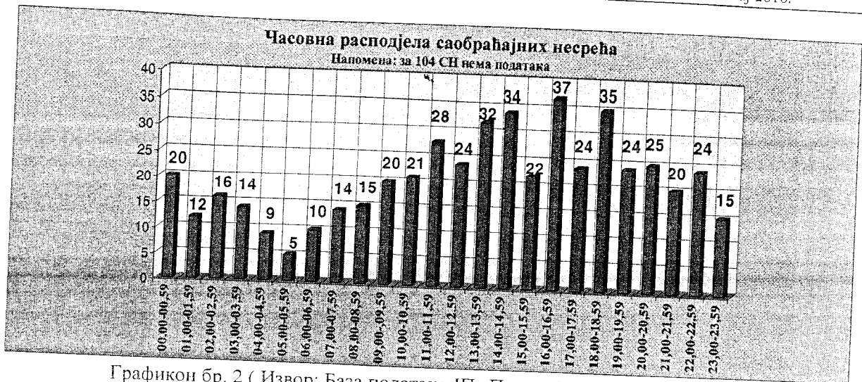
Графикон бр. 2

Користећи базу података ЈП „Путеви Републике Српске“, као и базу података саобраћајних незгода за 2007. годину, дошло се до временске расподеле саобраћајних незгода на простору града Бања Луке. На основу горе представљених графикана може се закључити да се вршини период у погледу саобраћајних незгода, у дневном интервалу, јавља суботом. Током тог дана саобраћај на простору Бања Луке је најинтензивнији, те је логично да број саобраћајних незгода буде и највећи.