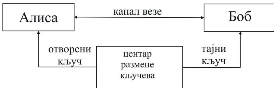
Слика 2. Структура асиметричног криптосистема

Асиметрични криптосистеми за рад користе два кључа, слика 2. Први кључ је отворен и доступан свим корисницима размене информација. Помоћу тог кључа се врши шифровање информације. Други тајни кључ поседује само прималац информације (Боб). Дешифровање информације помоћу отвореног кључа је немогуће. Такође, кључ за дешифровање није могуће одредити помоћу отвореног кључа за шифровање (Румянцев & Голубчиков, 2009).