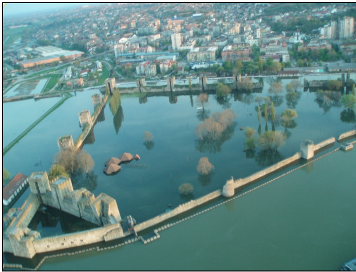
Слика 3. - Смедеревска тврђава поплављена 2006. године

зитета и трајања бујичних киша у сливовима и пропусне моћи корита. Висина штета од поплава непосредно зависи од удаљености материјалних добара од речних корита. Опасност је велика код водотока који протичу кроз град и поред тврђаве (Петријевски поток), кроз насеља (Раља и Језава) или у зони индустријских постројења (Раља и Језава у зони железаре).