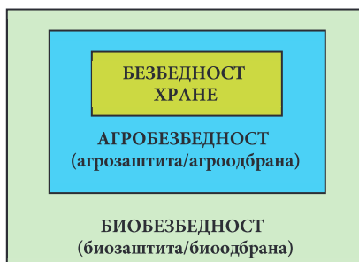
Слика 3. – Однос безбедности хране, биобезбедности и агробезбедности

Food security се генерално односи на несметану доступност физички и биохемијски здравој – безбедној храни. С тим у вези, безбедности хране подразумева физичке и економске могућности свих људи да у сваком тренутку постигну, односно обезбеде приступ „довољној количини здраве, квалитетне и хранљиве хране да би задовољили своје потребе у исхрани и за активан и здрав живот”. Значење безбедности хране у овом случају се углавном односи на разлику сиромаштва и глади. Друго значење је више везано за уобичајено значење „безбедности”, а односи се на „одбрану од угрожавања” прехранбених производа и свега што је у вези са њом (пољопривреда, сточарство, прехранбена индустрија, вода и др.). Food defence се односи и на акције супротстављања криминалцима или терористима који „користе” ланце снабдевања храном као средство за напад на пољопривредне и прехранбене капацитете и воду. Начелно, „одбрана хране” је „заштићеност хране и пића и њиховог ланца снабдевања од свих облика злонамерних напада, укључујући и идеолошки мотивисане нападе који могу изазвати загађења и општу угроженост” (Одређење British Standard Institute , према: Setola, De Maggio, 2009: 7061–7064).